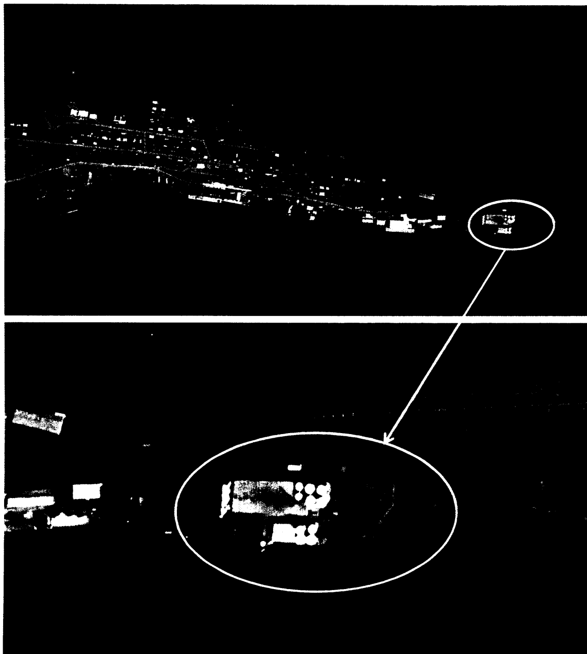
Mynd 1. Staðsetning fiskmjölsverksmiðju Loðnuvinnslunnar hf á Fáskrúðsfirði.

Á mynd 1 má sjá að fiskmjölsverksmiðja Loðnuvinnslunnar hf er staðsett yst í Búðakauptúni við norðanverðan botn Fáskrúðsfjarðar.